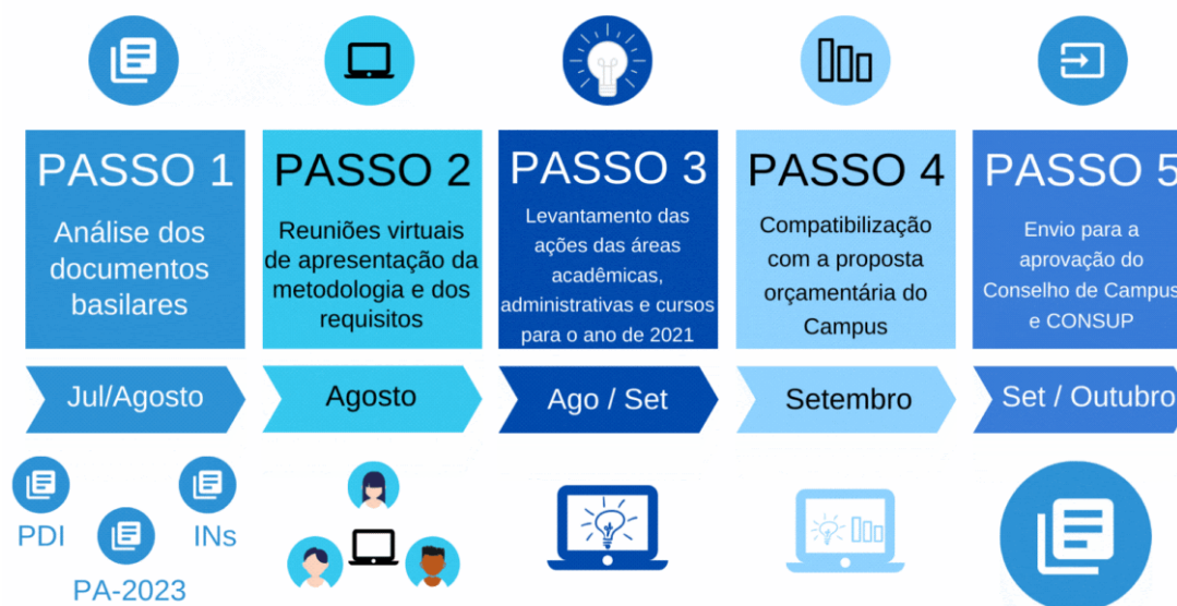
Figura 1: Metodologia do Plano de Ação 2024