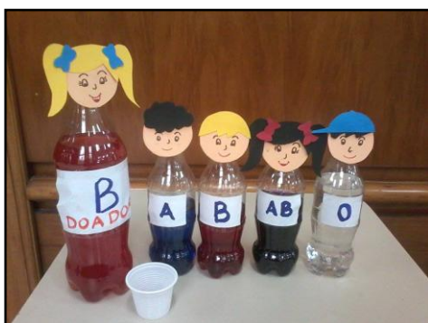
Figura 5: Kit de Compatibilidade Sanguínea