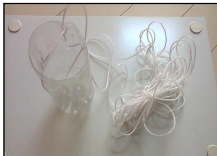
Figura 2: Coletor de água