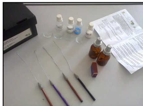
Figura 4 Kit do Teste da Chama