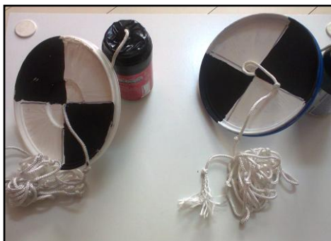
Figura 3: Disco de Secchi