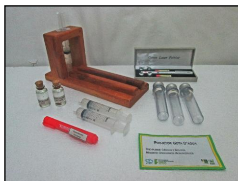
Figura 6: Microscópio Alternativo