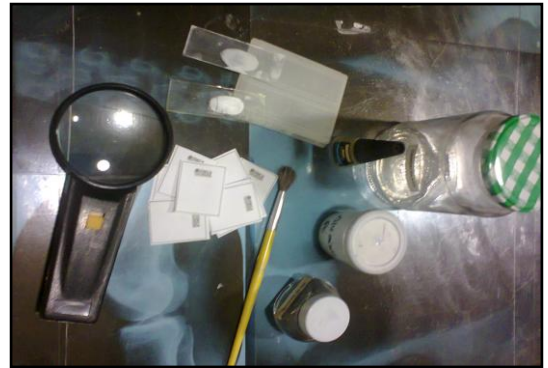
Figura 8: Kit Química Forense