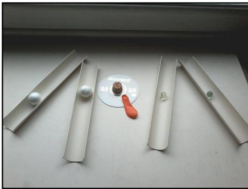
Figura 9: Kit das Leis de Newton